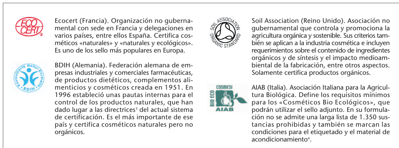
Fig. 1. Principales sellos de certificación de cosméticos en Europa.

Cada organismo certificador tiene establecidos sus propios criterios de exigencia para los productos cosméticos y en consecuencia, algunos organismos tienen criterios más estrictos que otros. Un cosmético certificado muestra en su material de acondicionamiento el sello o logo del organismo certificador. Es posible obtener más de una certificación, y por tanto, varios sellos pueden aparecer en el mismo cosmético (fig. 1).